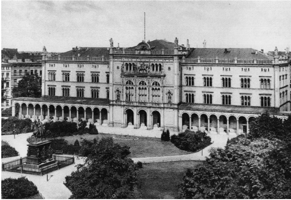
Königsberg. Die Neue Universität am Paradeplatz